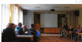
Dagen började med ett erfarenhetsutbyte på hembygdsgården i Skog.