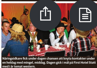
Näringslivdare fick under dagen chansen att knyta kontakter under en heldag med mingel, middag. Dagen gick i mål på First Hotel Statt med i år temat western.